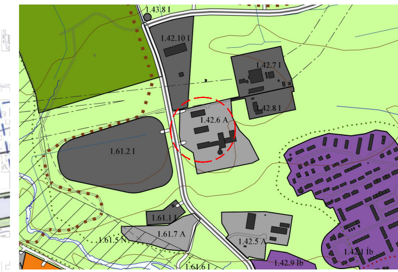
HLUTI ÚR SAMÞYKKTU AÐALSKIPULAGI AKUREYRAR 2005-2018

DEILISKIPULAGIÐ ÖDLADIST GILDI VIÐ AUGLÝSINGU MUM SAMÞYKKT ÞESS Í B-DEILD STJÓRNARTÍÐINDA ÞANN _____