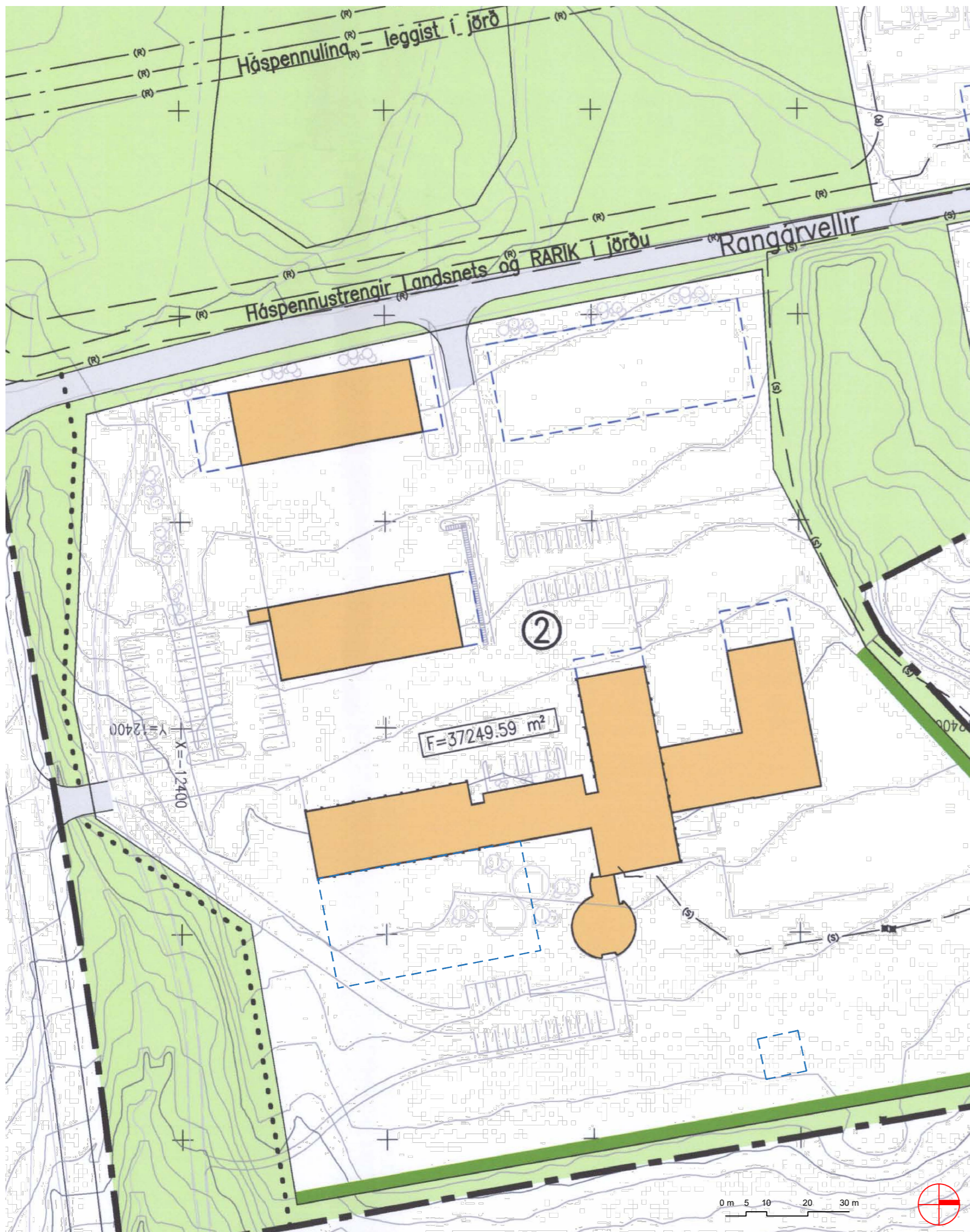
HLUTI ÚR SAMÞYKKTU DEILISKIPULAGI, TÓK GILDI 2. APRÍL 2007, SÍÐAST BREYTT 14. OKT. 2016 - MKV 1:1000